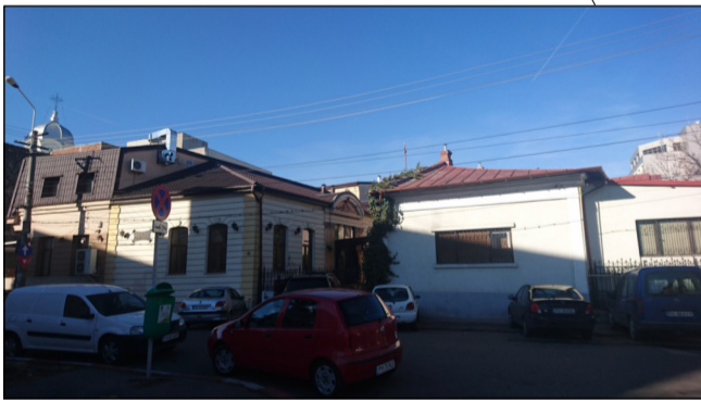
FATADA LA STRADA MARASESTI ( se pastreaza)